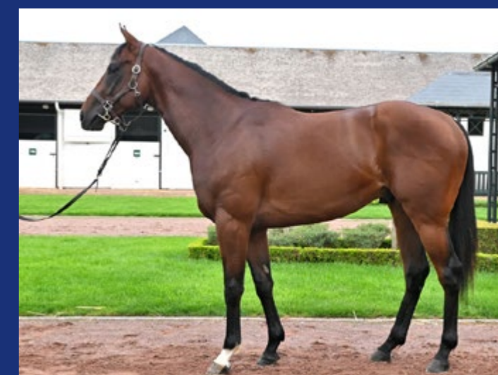
Breeze Up 2023 - Never Sell (M2) - 90.000 € Mayfield Stables à Blandford Bloodstock Ltd

En 2023, ses yearlings ont atteint jusqu'à 100.000 € et 90.000 € pour ses deux ans à la Breeze Up Arqana